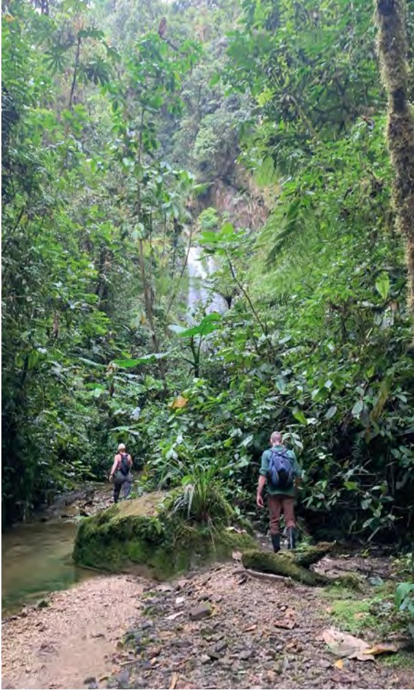
Hoch hinauf geht es in den dichten Nebelwald

Menschen, die kommen, um unseren Kampf zu unterstützen. Schulklassen besuchen uns, wir zeigen ihnen den Urwald und vermitteln ihnen den Wert sauberer Flüsse.“