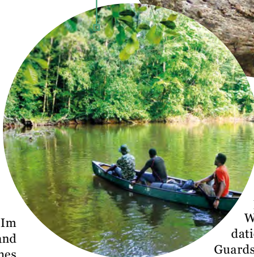
Mit Kanu und Zelt ans andere Ufer. Dort erwartet uns der Sapo Nationalpark

Weiter geht es nach Liberia , Heimat großer Teile des oberguineischen Regenwaldes und bedrohter Schimpansen. Unser Partner Wild Chimpanzee Foundation (WCF) schickt Eco-Guards aus den Dörfern in die Nationalparks Sapo und Grebo-Krahn auf Patrouille. Sie schrecken Wilderer ab und machen Fallen unschädlich. Auch dank der Forschung der Primatologen wurden neue Schutzgebiete geschaffen. Liberia - ein Leuchtturm im Schimpansenschutz!