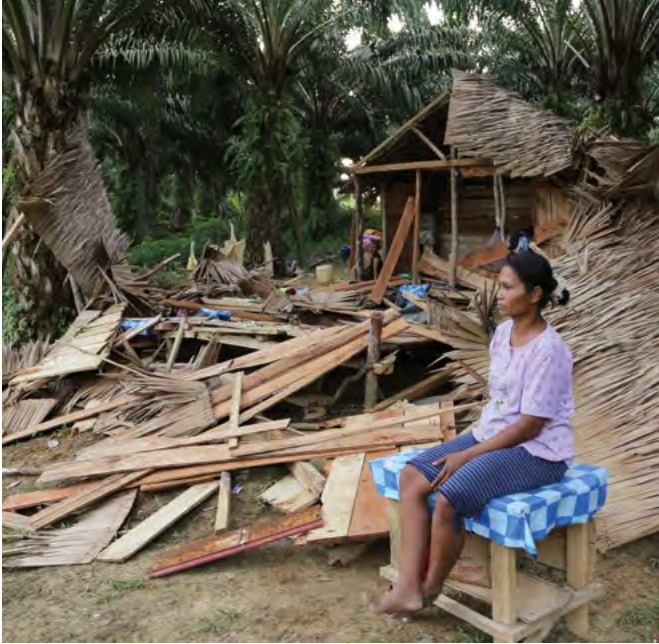
Die indigenen Suku Anak Dalam wurden vom Palmöl-Konzern Wilmar von ihrem Land vertrieben...