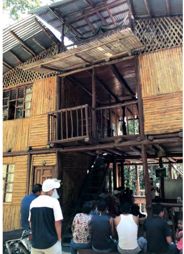
Die Touristenunterkunft ist ein Ort der Begegnung: Infos und Buchungen auf https://eco-cabanas-junin.com

Auch auf politischer und legaler Ebene gab es zahlreiche Erfolge. „2008 erklärte die damalige verfassungsgebende Versammlung fast 600 Bergbau-Konzessionen für nichtig, darunter bei uns“, sagt Hugo. „2023 hat unser