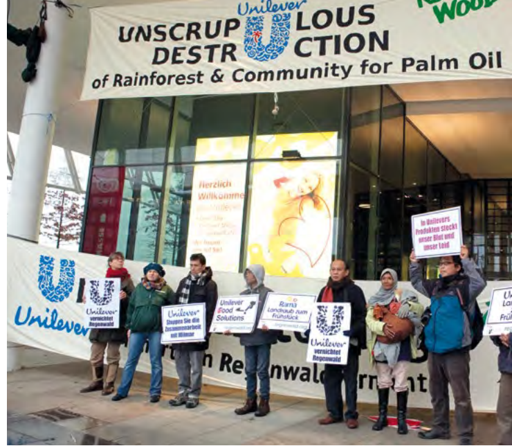
...vor dem Hamburg-Sitz von Unilever, Kunde von Wilmar, protestierten sie mit uns gegen die Zerstörung

Bis zum Palmölboom Mitte der 1980er-Jahre hatte Indonesien eine halbe Million Hektar Ölpalmplantagen. Dann alarmierten uns die indigenen Suku Anak Dalam aus Sumatra. Indonesische und ausländische Firmen raubten ihr Land und brandrodeten ihren Regenwald. Vorerst für Industrienernährung und Kosmetik, später für den Tank.