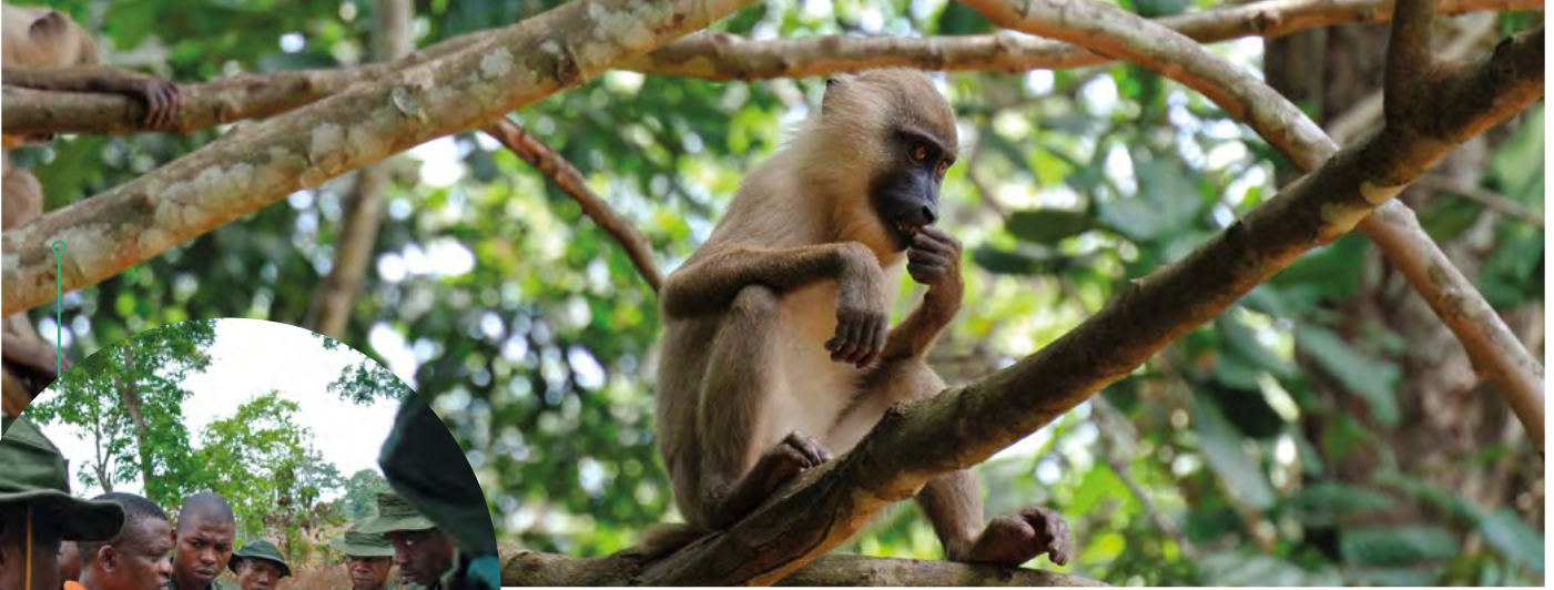
Auch Drills leben im Wald der Ekuri