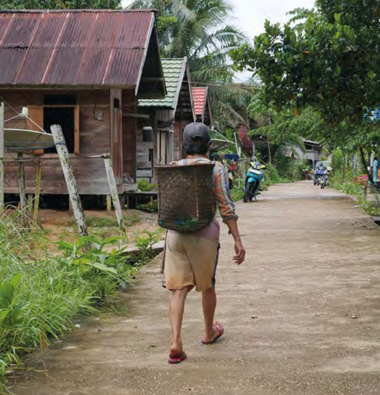
Die Gemeinde Tongka auf Borneo hat ihren Wald vor Zerstörung bewahrt