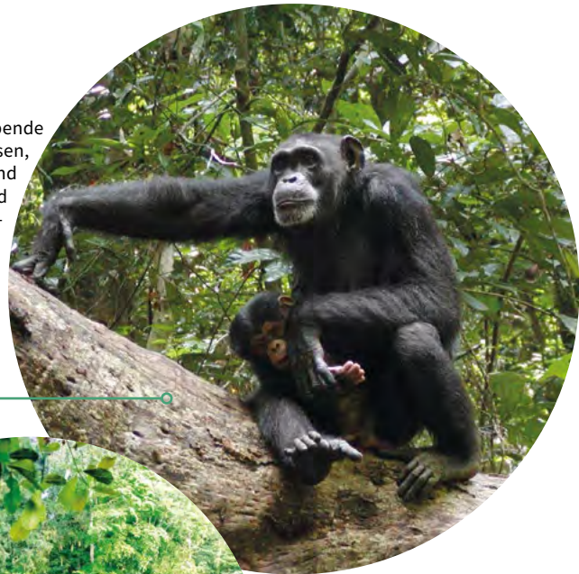
Frei lebende Schimpansen, Gorillas und Bonobos sind selten geworden in Afrika