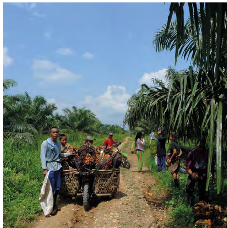
Sumatra: Arbeiter ernten Palmölfrüchte