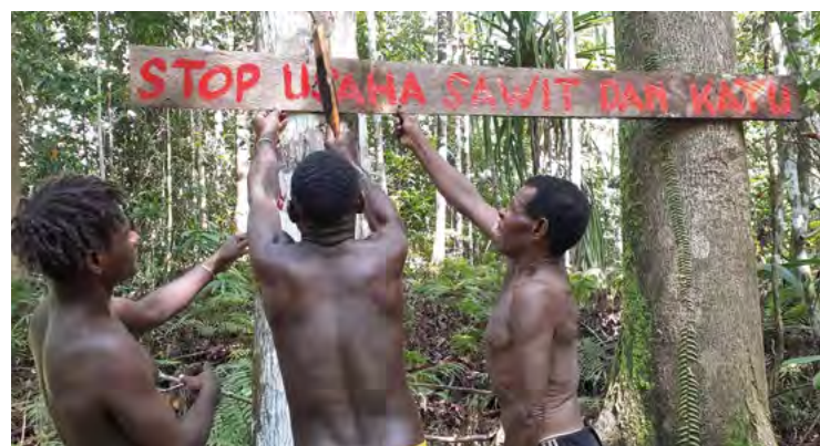
Protest in Papua: Stoppt die Palmölfirmen