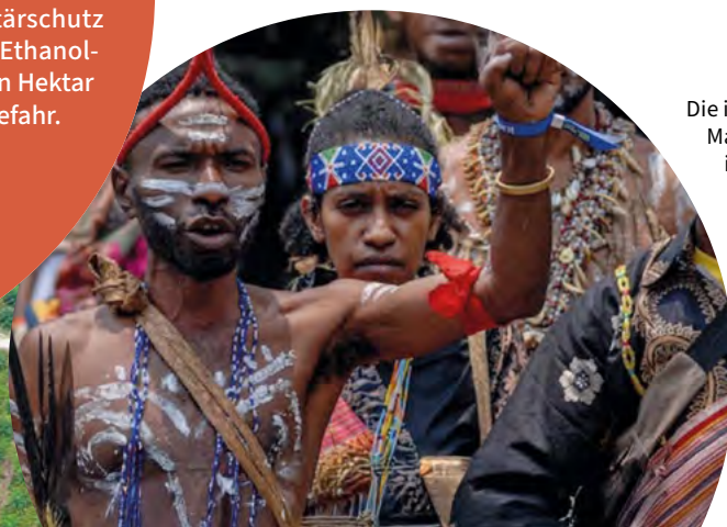
Die indigenen Marind wollen ihren Regenwald in Papua retten

Bitte unterschreiben Sie unsere Petition: regenwald.org/rr245