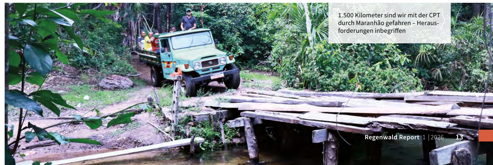
1.500 Kilometer sind wir mit der CPT durch Maranhão gefahren – Herausforderungen inbegriffen