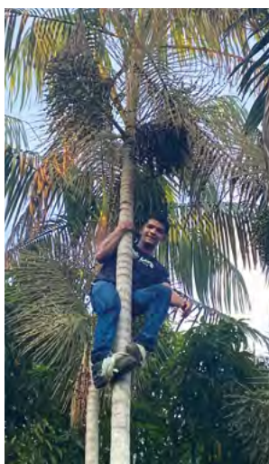
Die Ernte der Açai-Früchte braucht viel Geschick