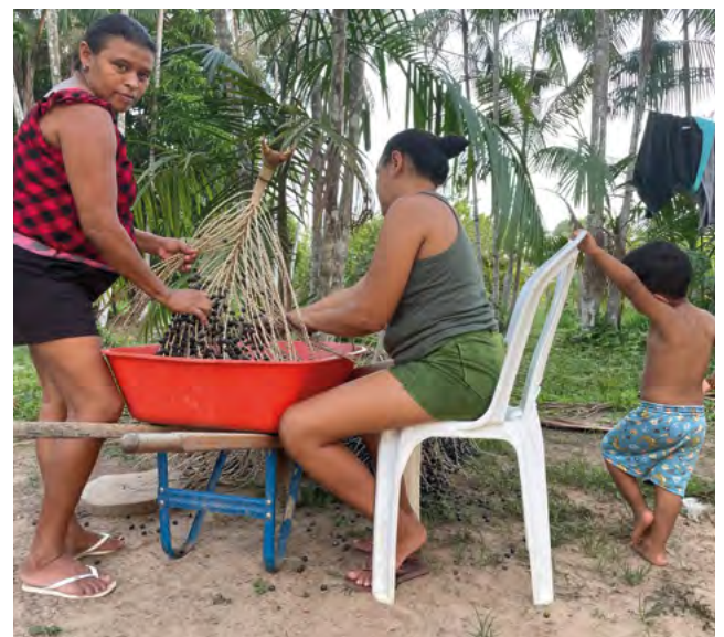
Die vitaminreichen Fr chte der A a -Palme sind ein beliebtes Nahrungsmittel

Stolz berichten sie von Neuigkeiten seit unserem letzten Besuch vor zwei Jahren: Viele Familien verkaufen jetzt ihre Fr chte und Gem se auf einem Marktstand in der Kleinstadt Cuatro Bocas. Sie haben daf r eine Kooperative gegr ndet und sind dabei, einen Laden zu  ffnen.