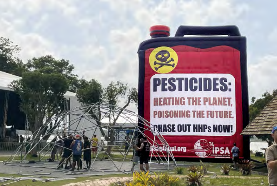
Aktion auf dem Gipfel der Völker: aufblasbarer Kanister gegen Pestizideinsatz der Agrarindustrie