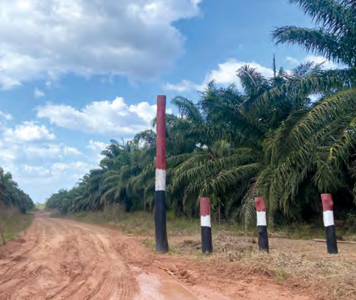
Bemalte Pfähle und ein Stopp-Schild markieren die wiederbesetzte Plantage