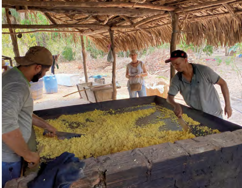
Hier wird Maniok geröstet – ein Grundnahrungsmittel im Nordosten von Brasilien

Produkte werden von europäischen Firmen hergestellt und sind bei uns wegen ihrer Gefährlichkeit verboten.