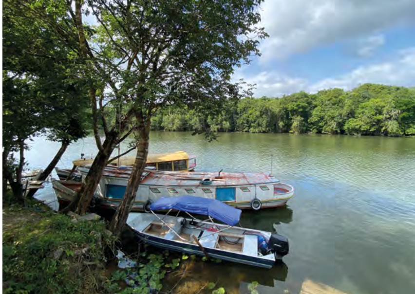
Der Acará ist die Lebensader der traditionellen Gemeinschaften