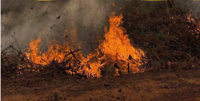
Ein Feuer zerstört die Natur im Cerrado