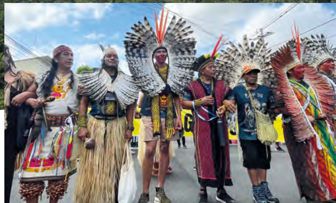
Zum Marsch für Klimagerechtigkeit haben sich Indigene aus aller Welt in Belém vereint

Im November 2025 richtete sich der Blick der Welt auf Belém, mitten im brasilianischen Amazonasgebiet, dem Austragungsort der UN-Klimakonferenz COP30. Umwelt- und Menschenrechtsgruppen setzten dem Treffen der Regierenden einen Gipfel der Völker entgegen.