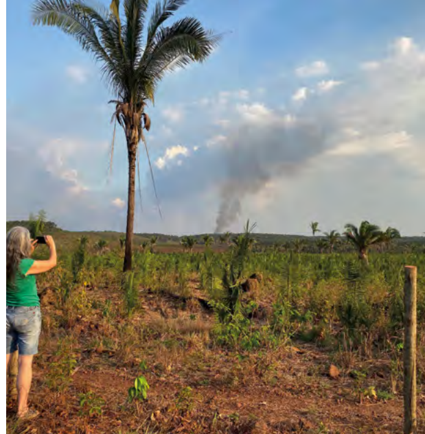
In Maranhão dokumentieren wir die Rodungen für Rinderweiden im Cerrado